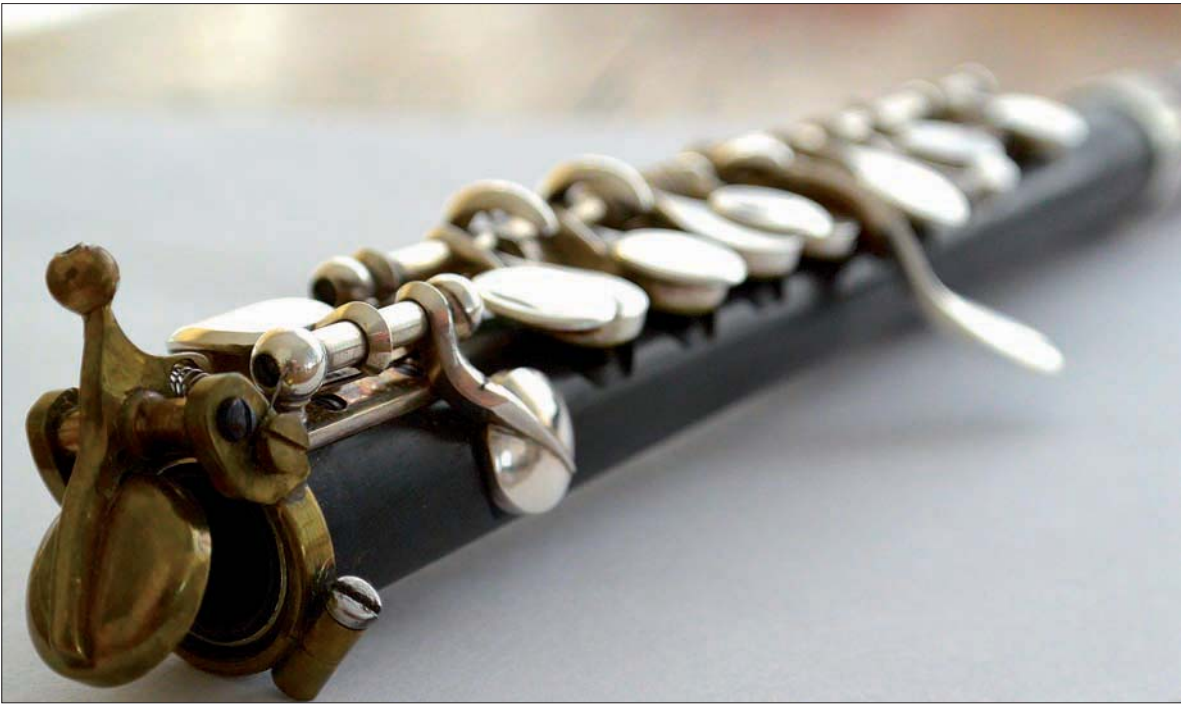
Piccolo met dé f-klep